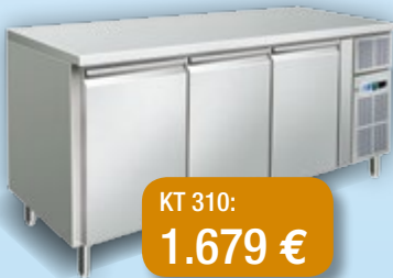
Abb. KT 310