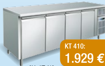
Abb. KT 410