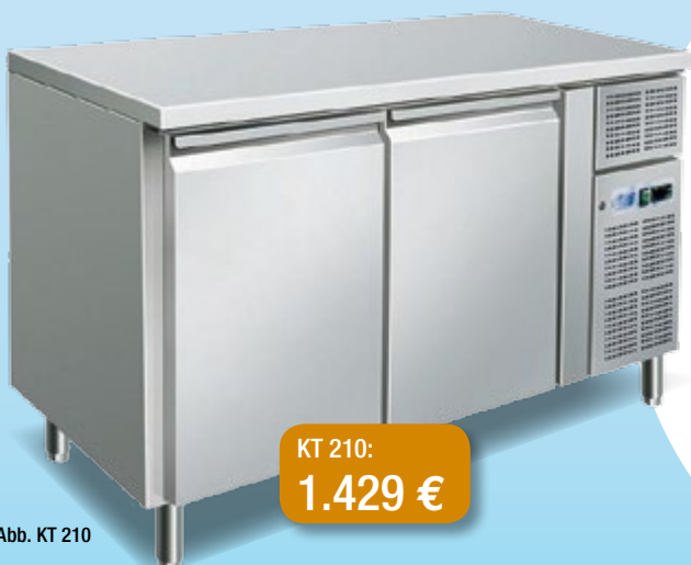
Abb. KT 210